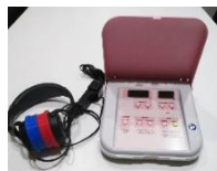
オーディオメーター