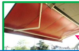
テラスのオーニングテント

中海こども園では、日よけ用に園庭側のテラスにオーニングテント、砂場にタープがついています。直射日光があたりず、風が涼しくて気持ちがいいです。