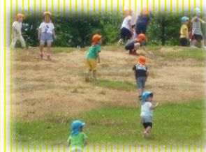
辰口丘陵公園にて