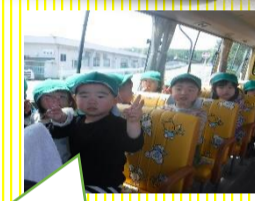
バス園外に行ってきまーす。