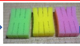
それぞれに16本の足を作ります