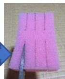
はさみで切ります