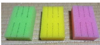
スポンジに8本の線をつけます