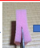
横にも切れ目を入れます