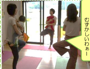
重心の むずかしいわぁー