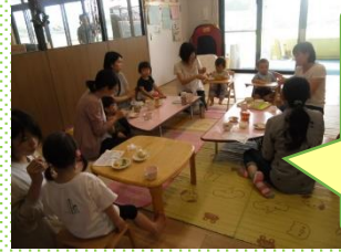
薄味になってるね 柔らかくて食べやすいね