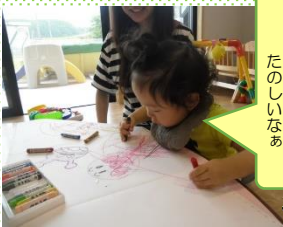
グルグルお絵かき たのしいなあ