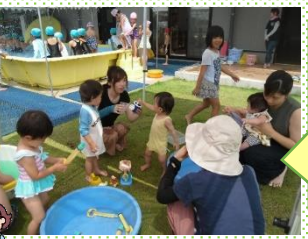
みんなで湯水遊び すく楽しい