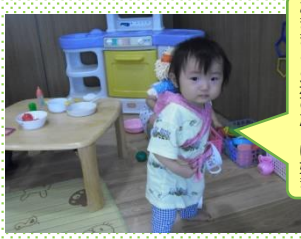
わたし、小さなお母さん おままごと遊びだーい好き