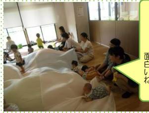
バルーンをバタバタ 面白いね